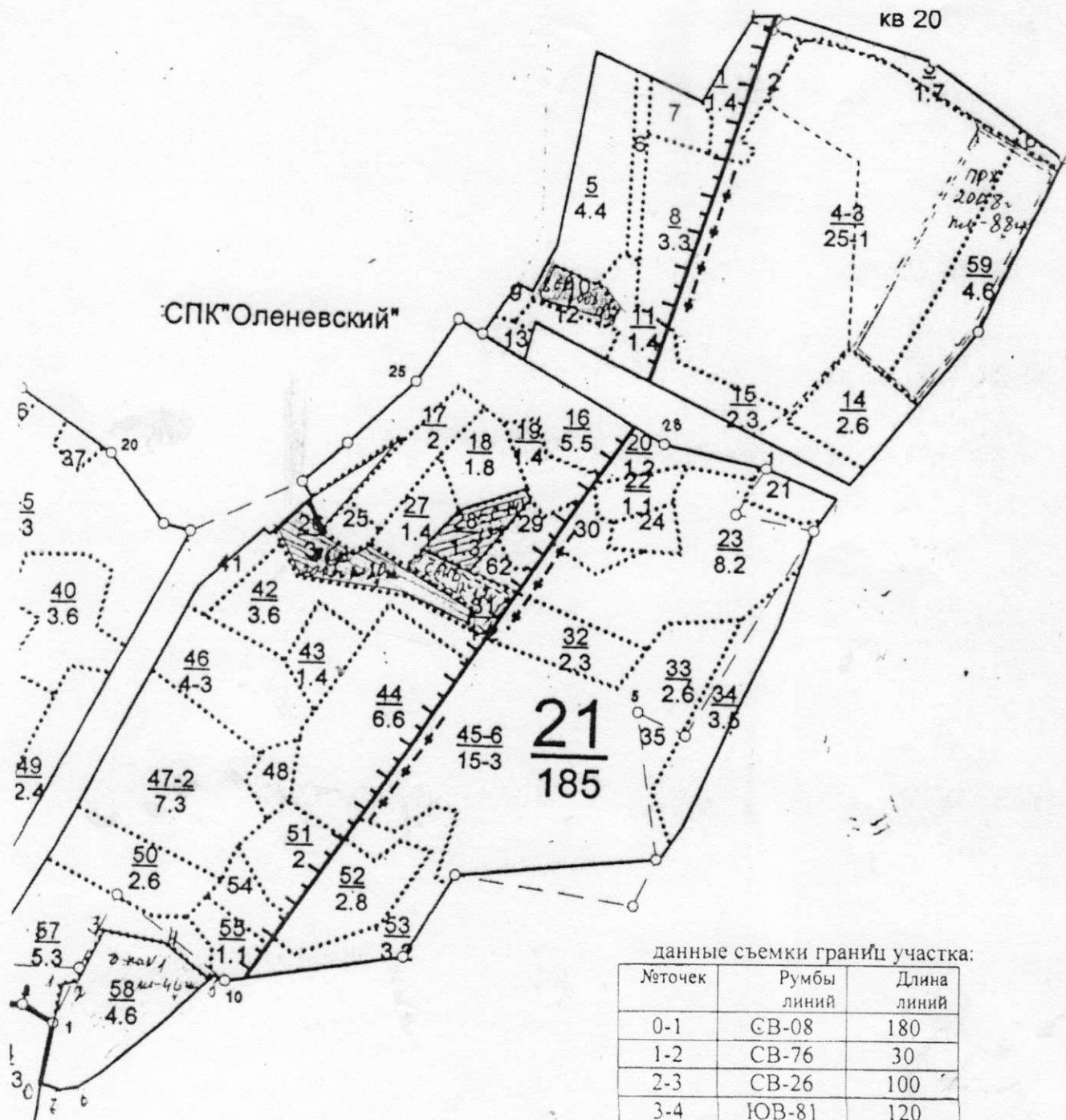
данные съемки границ участка: